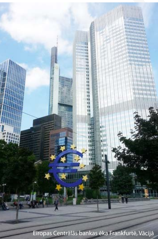
Eiropas Centrālās bankas ēka Frankfurtē, Vācijā

Latvijas divu eiro monēta, kas veltīta Rīgai – Eiropas kultūras galvaspilsētai 2014.