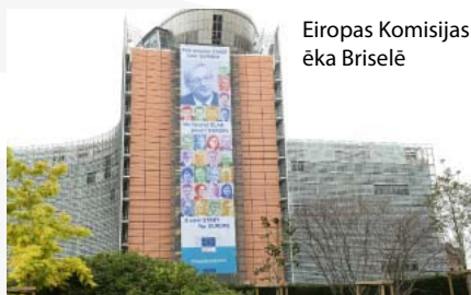
Eiropas Komisijas ēka Briselē

Komisāri ir EK politiskie vadītāji, bet tā sauktos Eiropas likumus raksta Komisijas ierēdņi – tie ir cilvēki, kuri nokārtojuši īpašus eksāmenus un strādā kādā no Komisijas ģenerāldirektorātiem jeb ministrijām Briselē vai Luksemburgā. Komisijā amata pienākumus pilda ierēdņi no visām 28 valstīm, viņu vidū ir arī apmēram 200 cilvēku no Latvijas. Līdzīgi kā komisāri, arī ierēdņi strādā nevis savas valsts, bet visas Eiropas interesēs.