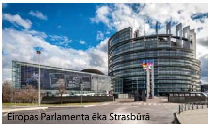
Eiropas Parlamenta ēka Strasbūrā

Sēdes, kurās deputāti balso par likumprojektiem, sauc par plenārsēdēm . Tās reizi mēnesī notiek Francijas pilsētā Strasbūrā un dažkārt arī Briselē, kur norit arī deputātu darbs komitejās. EP ir vēl trešā mitnes vieta – Luksemburga. Tur strādā daļa EP ierēdņu, piemēram, tulki.