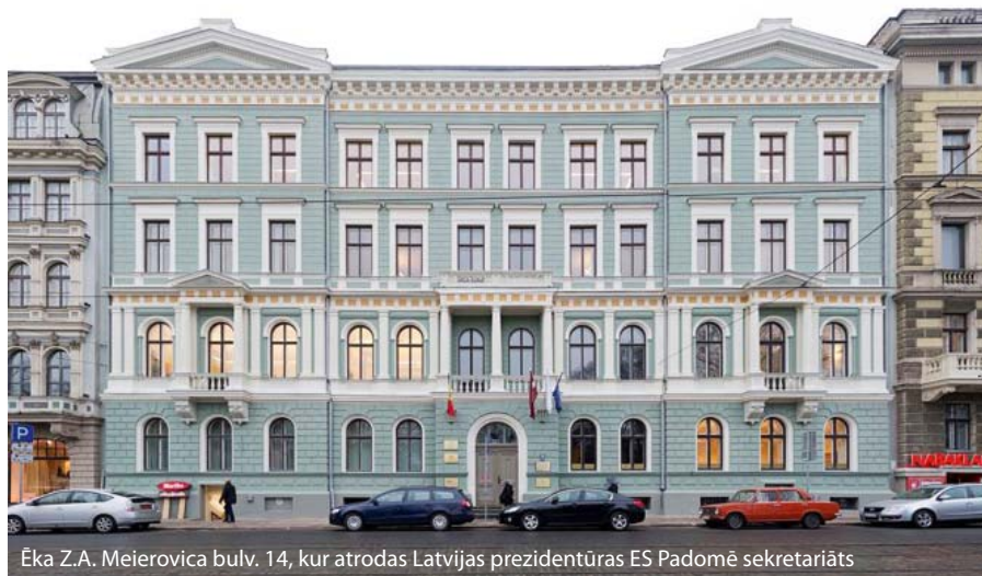
Ēka Z.A. Meierovica bulv. 14, kur atrodas Latvijas prezidentūras ES Padomē sekretariāts

Prezidentūras laikā tās norisē ir iesaistītas teju visas valsts pārvaldes iestādes, bet īpaša loma ir Latvijas Pastāvīgajai pārstāvniecībai jeb vēstniecībai ES. Tā atrodas Briselē un ir kā neliels Latvijas modelis. Pārstāvniecībā strādā cilvēki no visām Latvijas ministrijām, un viņu uzdevums ir nodrošināt prezidentūras norisi Briselē, kur notiks oficiālās ministru tikšanās.